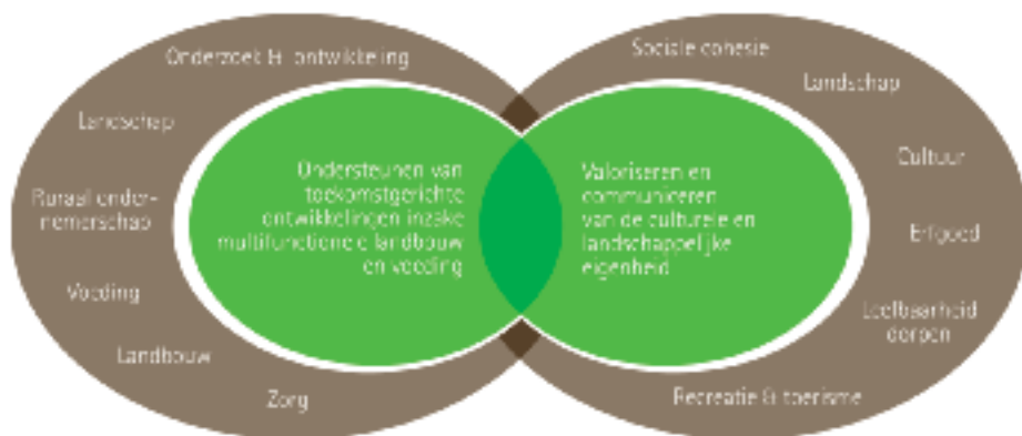
Figuur 8: De twee bindende thema's in het ontwikkelingsplan, in wisselwerking met subthema's

Deze bindende thema's mogen evenwel niet eng worden gedefinieerd. Ze vormen meer een middel, dan een doel op zich. Ze staan in een sterke wisselwerking met een heel aantal subthema's (zie schema).